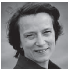
Giovanna Fossati , sinds 1 november hoogleraar Film-erfgoed en digitale filmcultuur (in samenwerking met EYE Film Instituut Nederland)

In december 2012 heeft het CvB besloten om in te stemmen met de opheffing van de bachelor Roemeense taal en cultuur. Er kunnen geen nieuwe studenten meer instromen per 1 september 2013, zittende studenten krijgen de gelegenheid hun opleiding af te ronden.